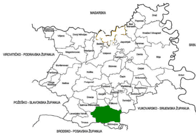
Slika 9. Položaj Grada Đakova u Osječko-baranjskoj županiji