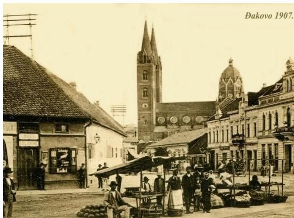
Slika 5. Đakovo 1907. godine

Prva banka u Đakovu osnovana je 1863. godine te je dobila naziv Hrvatska pučka štedionica. Njeni osnivači bili su đakovački obrtnici, Vlastelinstvo, Stolni kaptol Biskupije i građanstvo.