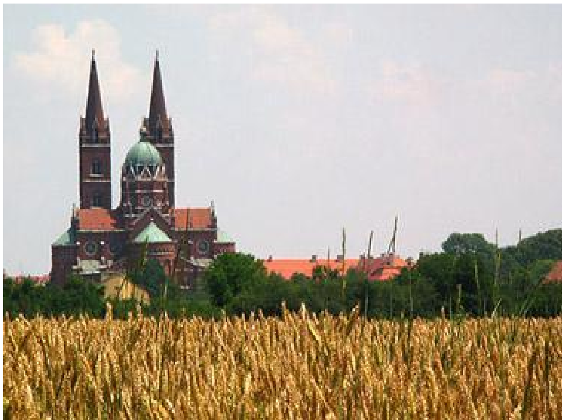
Slika 7. Đakovo

je Đakovo centar Đakovačko - osječke nadbiskupije. Zahvaljujući tome, osim prirodnim ljepotama, grad obiluje povijesnom građom, arheološkim nalazištima, sakralnim i kulturnim spomenicima, građevinama tradicionalnog graditeljstva. Sve to upućuje na bogatstvo priča i događaja vezanih uz povijest grada, koje iznova pobuđuju zanimanje za što boljim upoznavanjem malog grada u srcu Slavonije, grada Đakova.