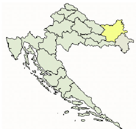
Slika 8. Položaj Osječko-baranjske županije u Republici Hrvatskoj