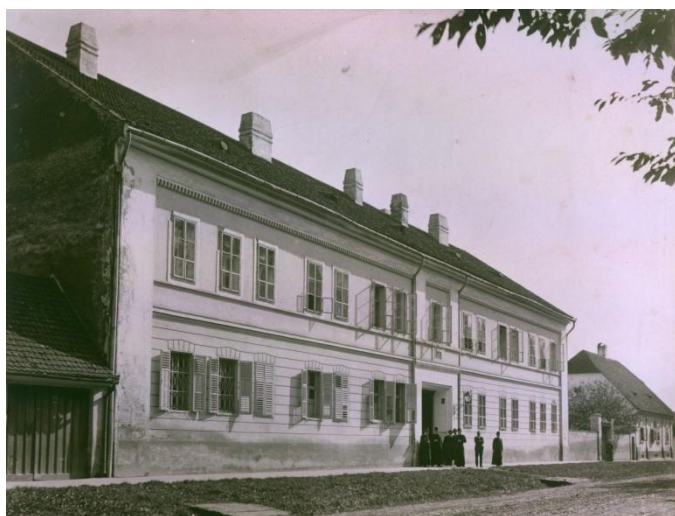
Slika 2. Katolički bogoslovni fakultet

Zahvaljujući biskupu Antunu Mandiću (1806.-1815.) otvara se Bogoslovno sjemenište s Visokom bogoslovnom školom koja je danas najstarija visokoškolska ustanova u Slavoniji i Baranji (današnji Katolički bogoslovni fakultet). Osim u školstvu, osjetan je i veliki doprinos u gospodarstvu, posebice u uzgoju vinograda, te se područje na kojem se uzgaja vinova loza i danas naziva: Mandićevačko vinogorje.