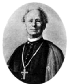
Slika 3. Biskup Josip Juraj Strossmayer

Za vrijeme biskupa Emerika Raffaya (1816.-1830.) osim što se gradi novo biskupsko krilo, sadi se i veliki biskupski park, danas znan kao Strossmayerov park. Ovaj perivoj zaštićeni je spomenik parkovne arhitekture. U njegovom donjem dijelu perivoja nalazi se amfiteatralna ljetna pozornica na kojoj se od 1967. godine održavaju folklorne priredbe nadaleko poznatih Đakovačkih vezova.