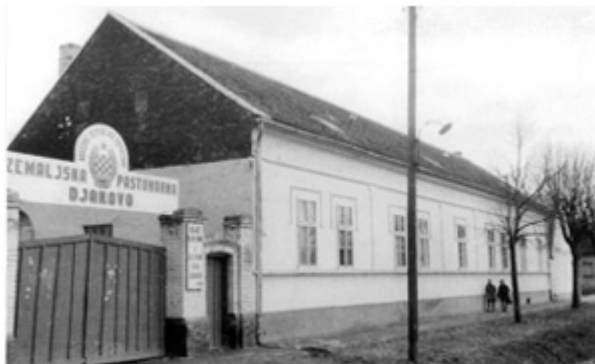
Slika 6. Ergela tijekom povijesti

Prvi pisani trag o konjima na ovom području je darovnica iz 1374. godine kojom bosanski ban Tvrtko u znak zahvalnosti zbog vjenčanja s bugarskom princezom Dorotejom, daruje biskupu Petru jedan posjed i stado od deset arapskih kobila i ždrijepca.