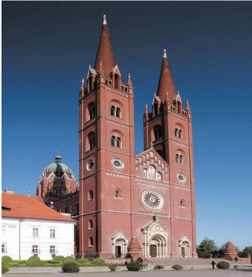
Slika 4. Katedrala Sv. Petra u Đakovu

Nemjerljiv doprinos gradu je izgradnja katedrale - bazilike Sv. Petra koja je sagrađena u neogotičkom – romanskom stilu. Gradnja je trajala punih 16 godina od 1866.-1882. Za gradnju je potrošeno 7 milijuna opeka koja je pečena u Đakovu, u biskupskoj ciglani, a ostali materijal se dopremao iz Istre, Austrije, Mađarske, Italije, Francuske i s drugih strana. Za slikanje katedrale izabrani su najbolji njemački slikari, otac i sin Seitz koji su živjeli u Rimu, a po umjetničkom usmjerenju bili su "rimski nazarenci".